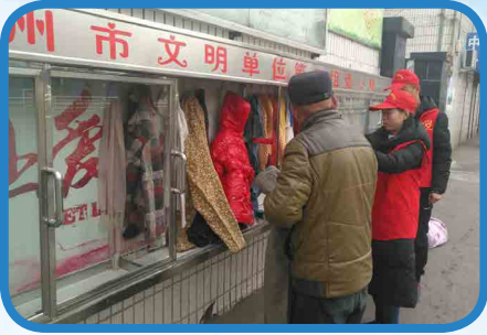
12月19日，我院将教职工捐赠的衣物送到位于太行路的爱心墙处，并帮助来往老人挑选御寒衣物。