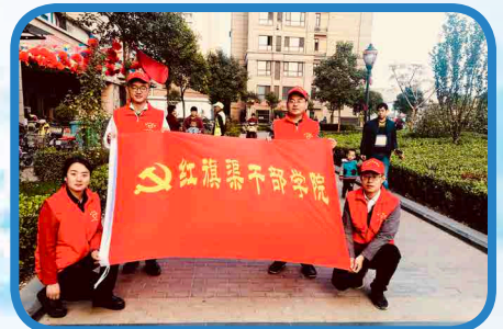
12月，我院积极开展文明志愿服务活动，进村入户，保质保量完成志愿服务活动。