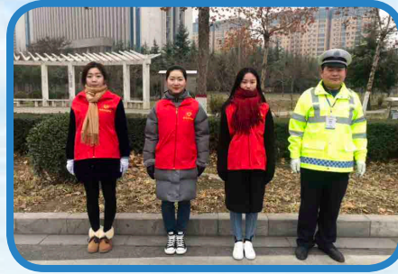
12月20日，我院志愿者组成的全国文明城市验收学院服务小组不顾深冬严寒，在早上7点准时到岗迎检。